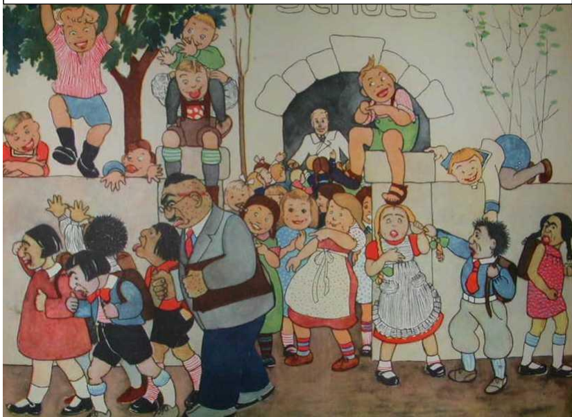
« Maintenant, tout ira bien dans cette école car les Juifs s'en vont »

1/ Recherches (Wikipédia, Vikidia...) : Quand Adolf Hitler a-t-il écrit Mein Kampf ? De quoi parle-t-il dans ce livre ?